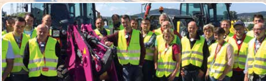
Frohe Weihnachten und einen guten Rutsch wünscht Ihnen Ihr Team vom Maschinenring und Bodenverband